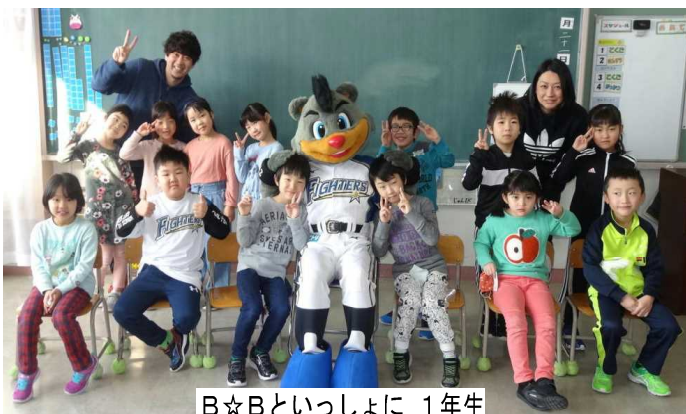
B☆Bといっしょに 1年生